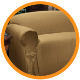
2. CHAIRS/COUCHES SILLAS/COUCHES