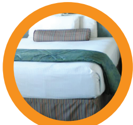
5. MATTRESS/ COMFORTER COLCHÓN/CONSOLADOR