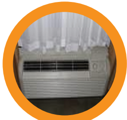
4. HEAT/AC VENT CALOR/AC VENT