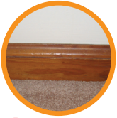
1. BASEBOARDS ZÓCALOS