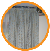
3. DRAPES/CURTAINS/BLINDS TAPICES/CORTINAS/PERSIANAS