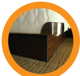
6. BOX SPRING LA BASE DEL COLCHÓN