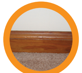
1. BASEBOARDS ZÓCALO

Daily Prevention Instructions on reverse side.