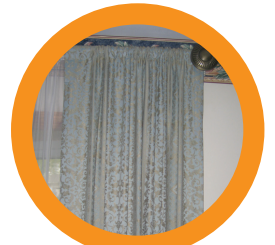
3. DRAPES/ CURTAINS/BLINDS TAPICES/ CORTINAS/PERSIANAS