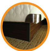
6. BOX SPRING LA BASE DEL COLCHÓN

1. Remove the cushions from both chairs and couches and apply RestAssure™ all around the inside of the furniture as well as over the entire cushion. Pay special attention to the piping and any tears.