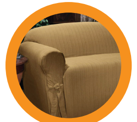
2. CHAIRS/COUCHES SILLAS/COUCHES