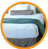
5. MATTRESS/COMFORTER COLCHÓN/CONSOLADOR