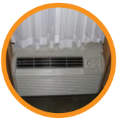
4. HEAT/AC VENT CALOR/AC VENT